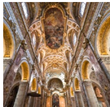
San Luigi dei Francesi

De renaissancestische gevel van Giacomo della Porta voor het Palazzo della Sapienza (1303), de oorspronkelijke huisvesting van de universiteit, herbergt verreweg de mooiste binnenplaats van de stad. De dubbele galerij wordt aan het einde afgesloten door de originele gevel van Sant'Ivo, Borromini's ingewikkelde spel van holle en bolle rondingen. Het hoogtepunt is de koepel. Het interieur valt wat tegen, ondanks het altaarstuk van Pietro da Cortona. Als de binnenplaats is gesloten, kunt u de koepel zien vanaf het Piazza Sant'Eustachio.