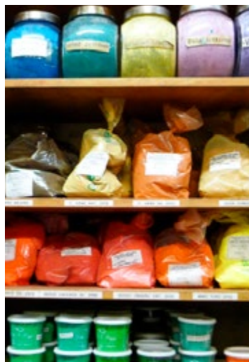
De producten van Ditta G. Poggi

1 Ditta G. Poggi Kaart M3 ■ Via del Gesù 74 Een van de beroemdste winkels in Rome met kunstenaarsbenodigdheden, van olieverf en schetsboeken tot potloden en houtskool.