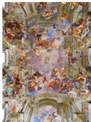
Fresco's Sant'Ignazio di Loyola