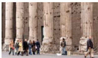
Tempel van Hadrianus

1 Tempel van Hadrianus Kaart M2 ■ Piazza di Pietra 9A ■ Alleen vanbuiten te bezichtigen (binnen voor culturele evenementen) Elf zuilen resteren van deze door zijn adoptiezoon Antonius Pius gebouwde Hadrianustempel.