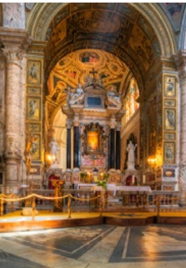
Santa Maria del Popolo