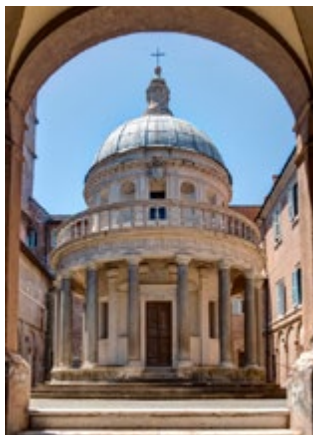
De 16de-eeuwse Tempietto

Kaart C5 ■ Piazza San Pietro in Montorio ■ 06-5813940 ■ Di-vr 9.30-12.30, 14.00-16.30 uur Het opvallendste renaissanciegebouw van Rome, met een perfect ronde Dorische tempel die Bramante in 1501 bouwde op de plek waarvan men dacht dat Petrus er was gekruisigd.