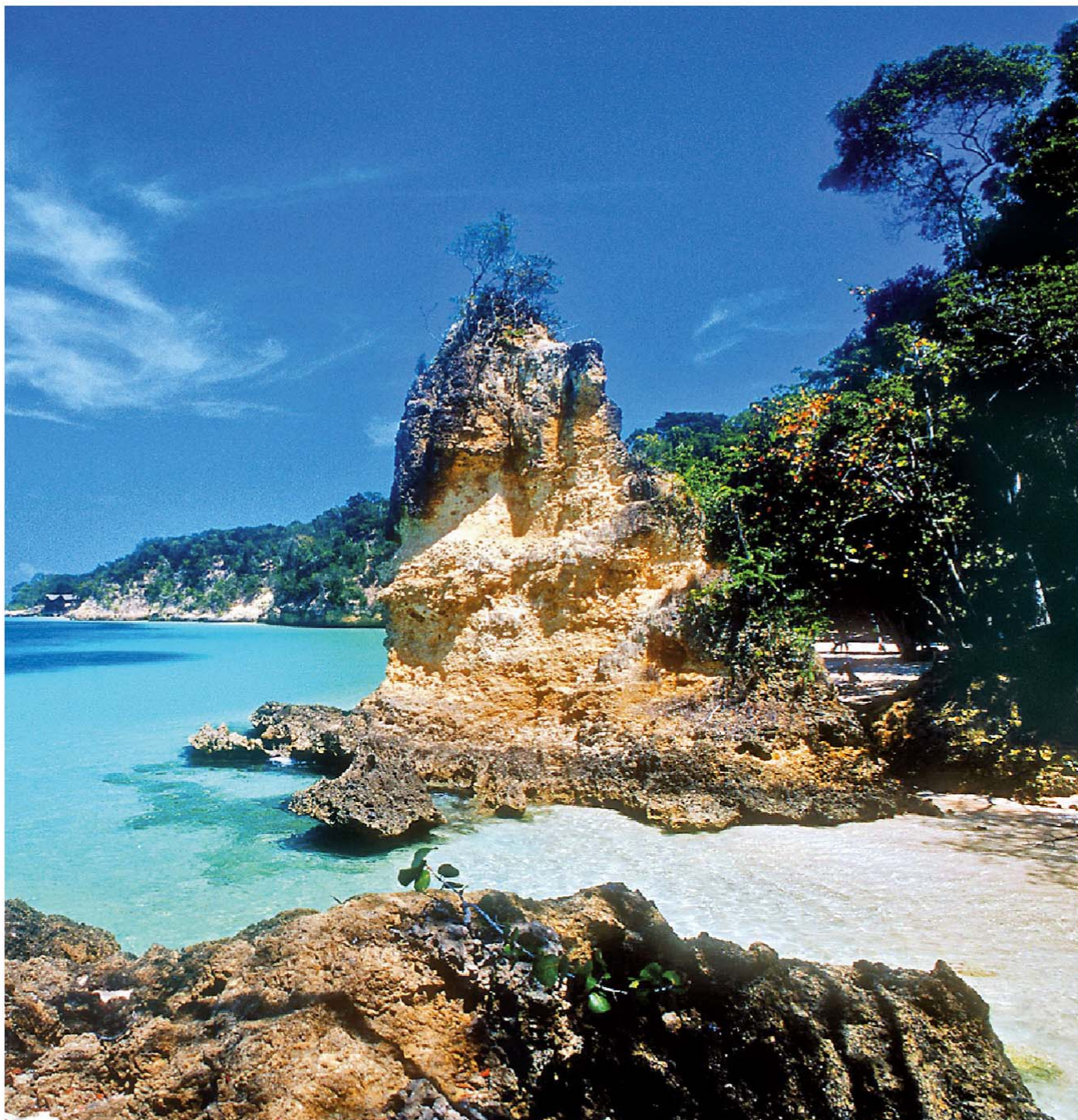
Cayo Saetia is een paradijselijk eilandje voor de noordkust van Oost-Cuba

gaat de Sierra Maestra over in het landschapelijk zeer interessante bergland van de Sierra de Baracoa en de Sierra de Cristal. Het Parque Nacional Alejandro de Humboldt, dat ruim 57.000 ha in het oosten van Cuba beslaat, biedt plaats aan veel planten en dieren die nergens anders zijn te vinden.