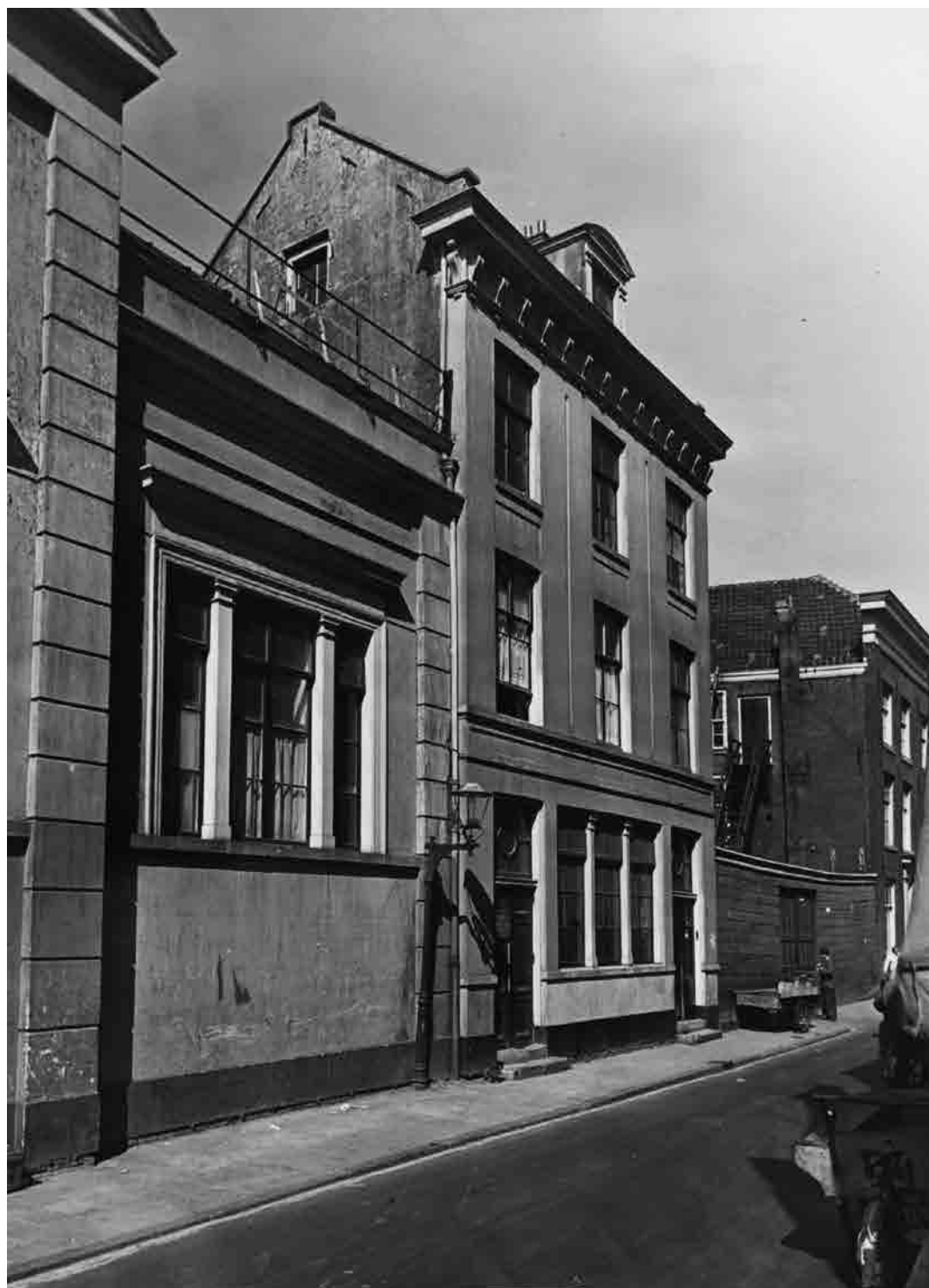
Rapenburgerstraat 4 (midden), ongedateerd