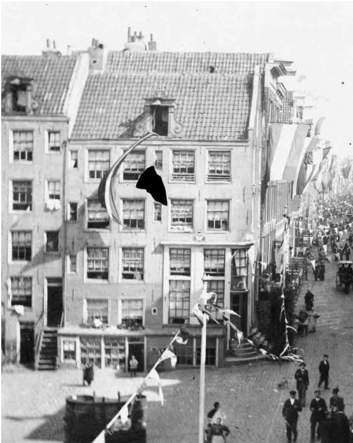
De Rapenburgerstraat, september 1898. Vlagvertoon ter gelegenheid van de inhuldiging van Wilhelmina als koningin