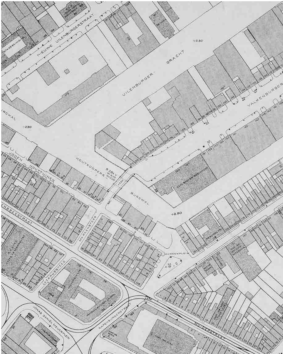
De Rapenburgerstraat in 1935-1937. Een deel van de Kaart van Amsterdam, Dienst Publieke Werken, Amsterdam