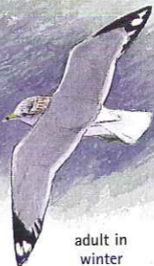
adult in winter