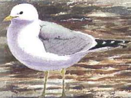
adulte vogels in zomer