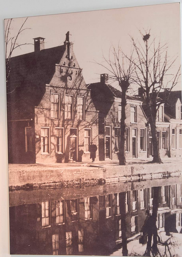
GRAND CAFÉ HET HUIS MET DE DUIVENGATEN