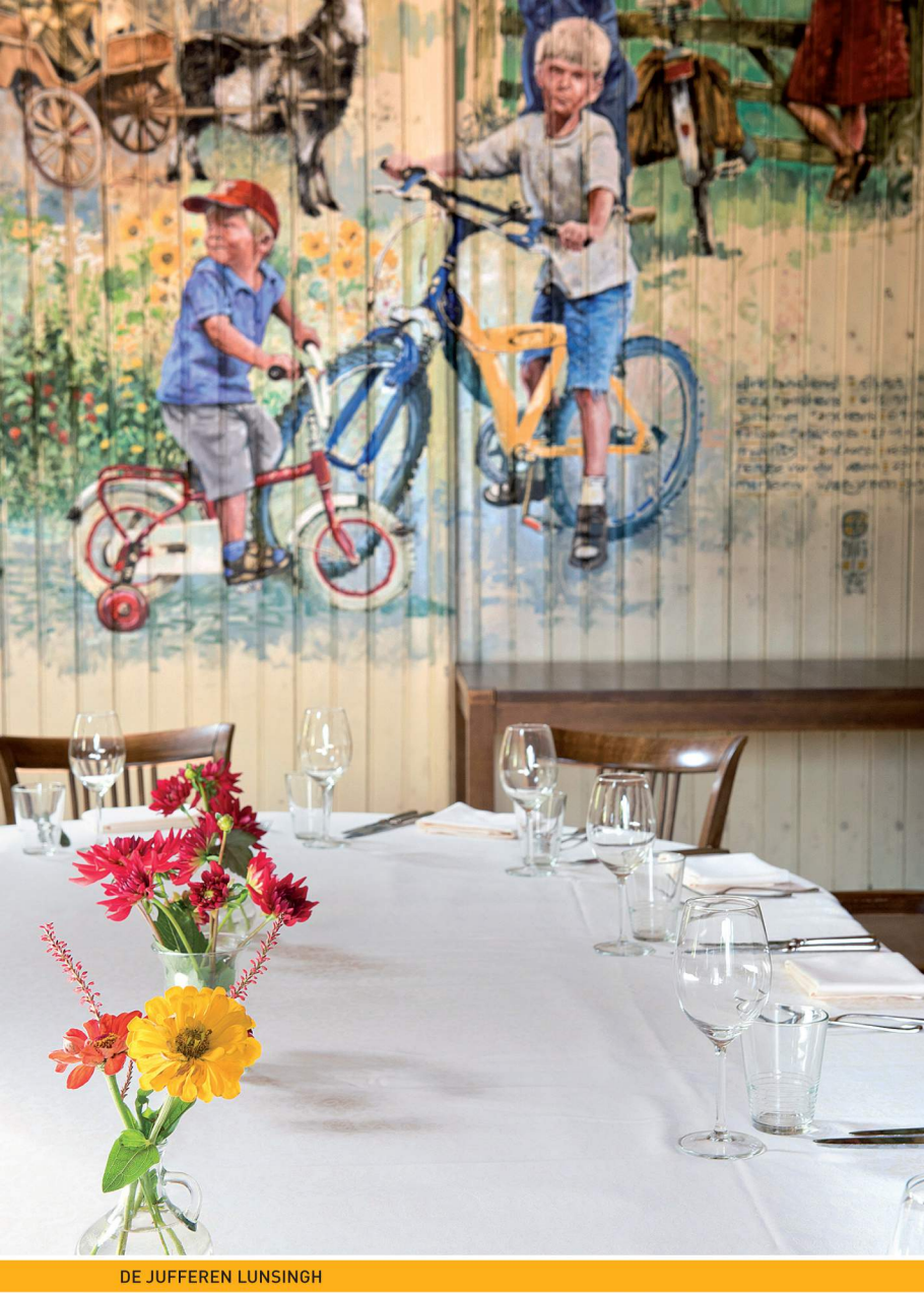
DE JUFFEREN LUNSINGH

veerd in de huiskamer of in de tuin van de Saksische boerderij. Veel producten zijn biologisch en deels komen ze uit eigen tuin.