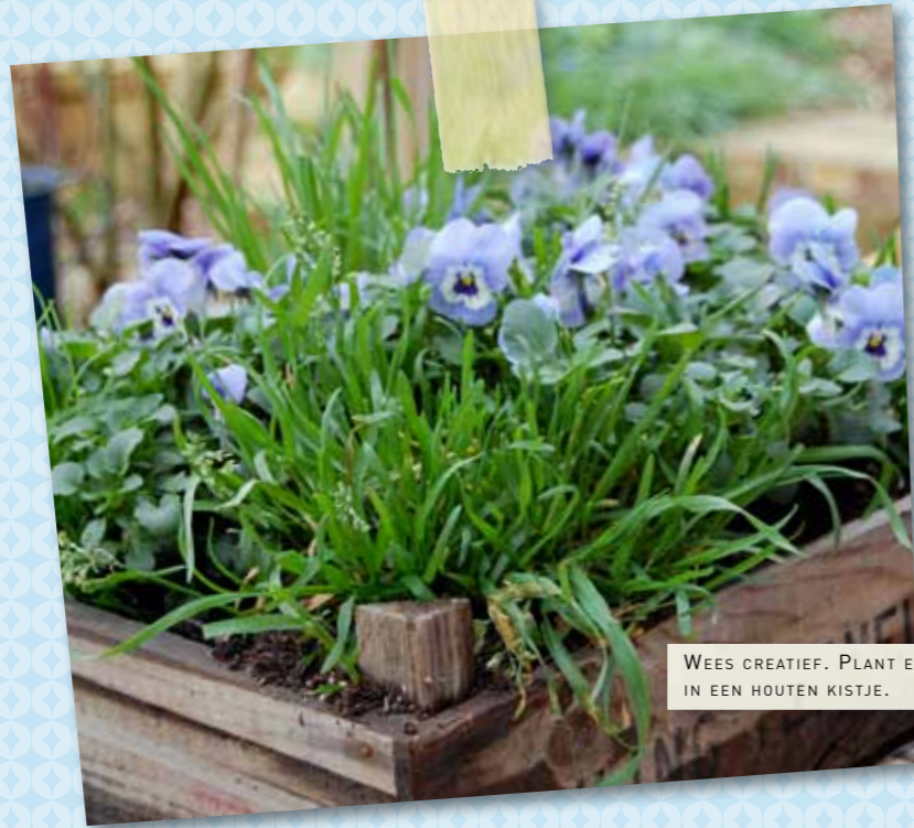
WEES CREATIEF. PLANT EETBARE VIOOLTJES IN EEN HOUTEN KISTJE.