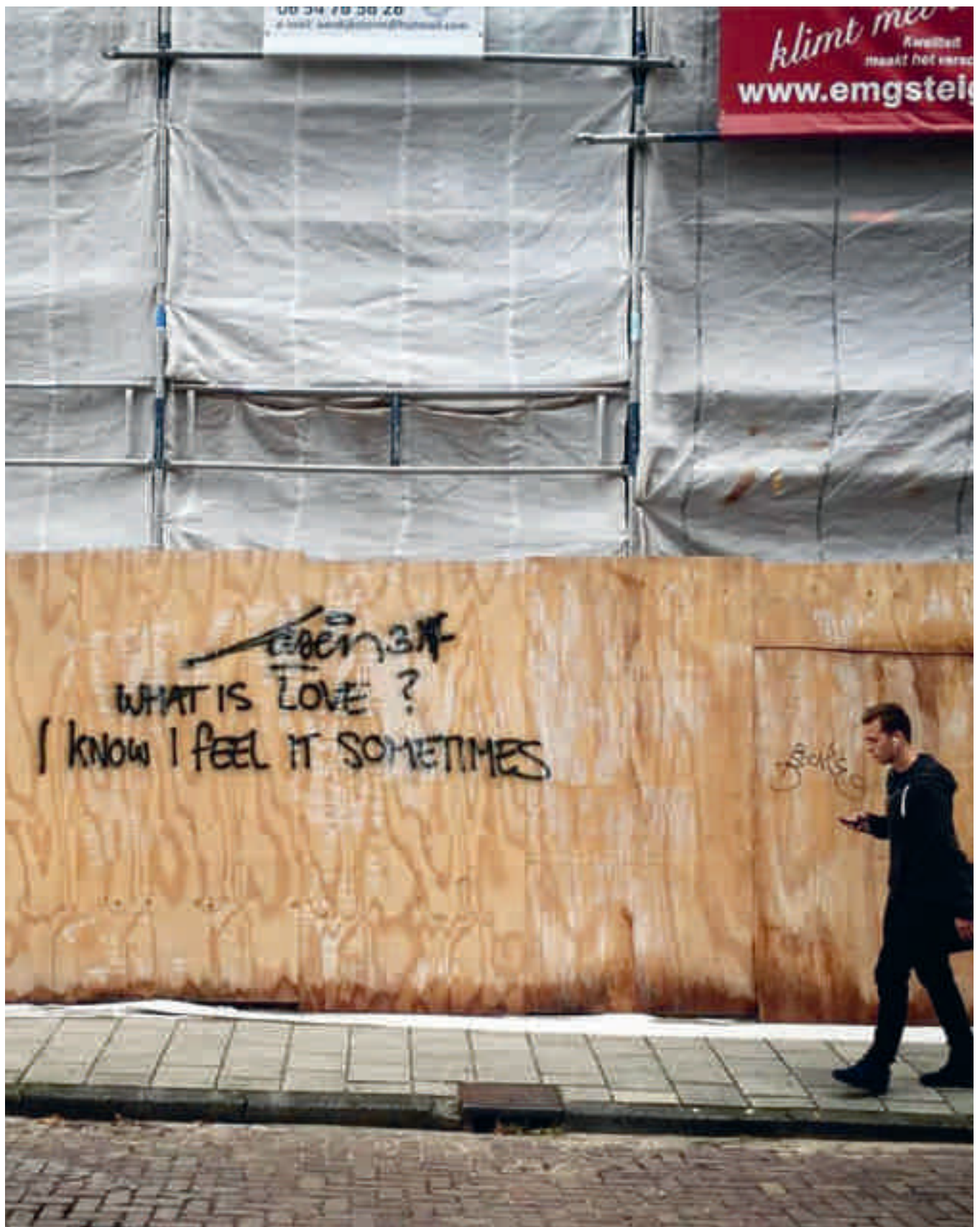
Buitenzijde omslag: Kunstenaarscollectief Observatorium Rotterdam, Zandwacht , Maasvlakte 2, recreatiestrand, Rotterdam.