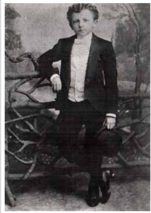
Henk Sneevliet in 's-Hertogenbosch, gefotorafeerd circa 1890