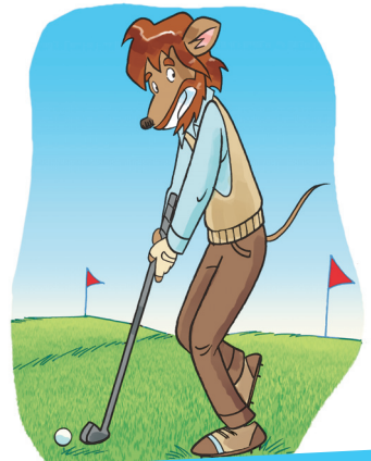
ODYSSEUS, DE GOLFKAMPIOEN!

Ik krabbelde overeind, schudde mijn vacht uit en liep naar Benjamin en Pandora toe om hen te vertellen wie de echte Odysseus was, toen een hevig GEDONDER mijn aandacht trok.