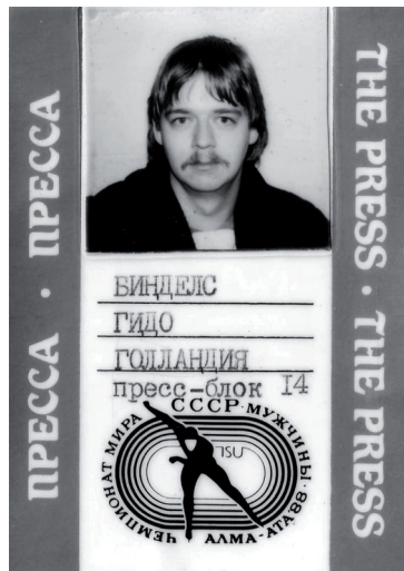
Accreditatie WK schaatsen Alma Ata

Had ik gedacht, want eenmaal op de plaats van bestemming aangekomen worden we opgewacht door een Sovjetdelegatie, die een rondleiding voor ons door de stad heeft gepland. Niemand van ons wil, iedereen wil eigenlijk nog maar één ding: slapen. Maar alle protesten helpen niet, we worden een bus in gestuurd en moeten en zullen die rondleiding krijgen. Bovendien moeten en zullen we ons ook nog eerst dienen te accrediteren.