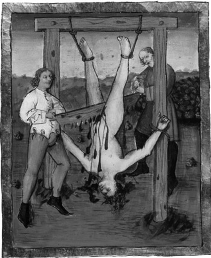
Uitvoering van de doodstraf kende in de middeleeuwen vele vormen. Dit is er één van.

1 . De doodstraf betekent een schending van het recht op leven. Het recht op leven is vastgelegd in de Universele Verklaring van de Rechten van de Mens. Bovendien is het een vorm van marteling. Het recht op een leven vrij van marteling is eveneens een mensenrecht. Diverse executiemethoden zijn een schending van het Verdrag tegen Foltering en andere Wrede, Onmenselijke en Onterende Behandeling of Bestrafing. Dit geldt bijvoorbeeld voor stening en het gebruik van gas om iemands leven te beëindigen. Waarschijnlijk geldt het ook voor ophanging. En in Amerika groeit de twijfel over de dodelijke injectie. Het wachten op de voltrekking van het doodvonnis is ook een vorm van wrede en onmenselijke behandeling. Veel gevangenen in de dodencel ervaren grote angst over hun naderende dood. Dat wachten kan vele jaren duren. Over het leed en de marteling die de veroordeelden anderen (onschuldigen) hebben aangedaan zegt deze club niets...).