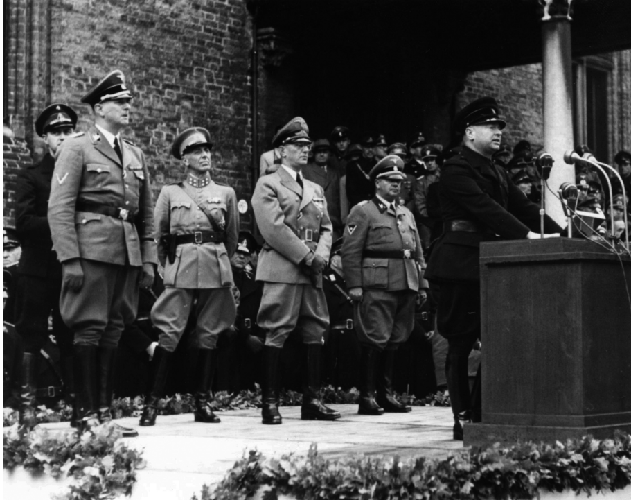
Anton Mussert spreekt... wikipedia

Als je de berichten in de verschillende media eens goed bekijkt, lijken die punten zo gek nog niet. Onder het mom van persvrijheid vliegen de (vaak valse) beschuldigingen en beledigingen je om de oren.