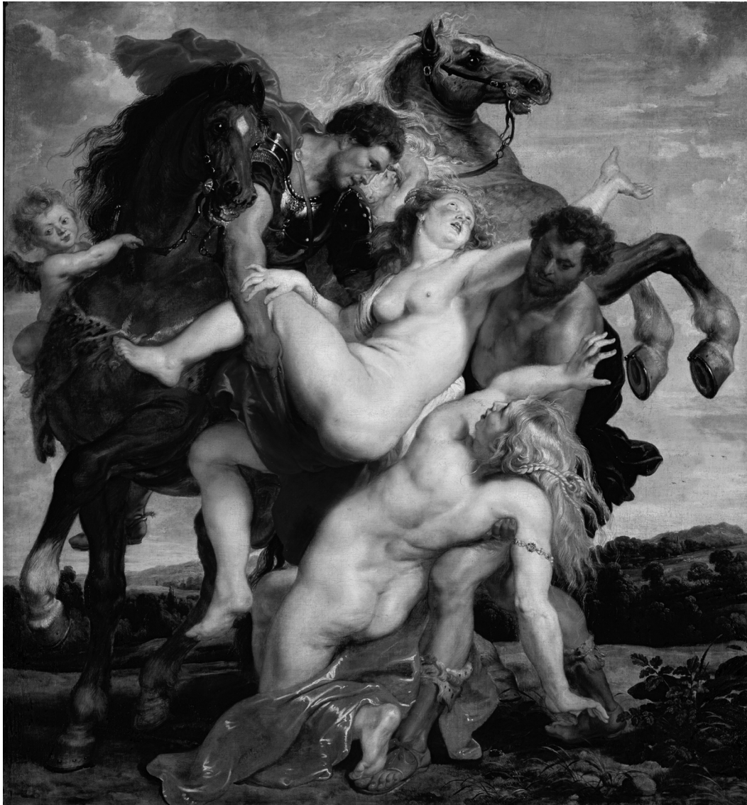
De ontvoering van de Dochters van Leucippus. Een Rubens. Ontvoering leidt maar al te vaak tot verkrachting.