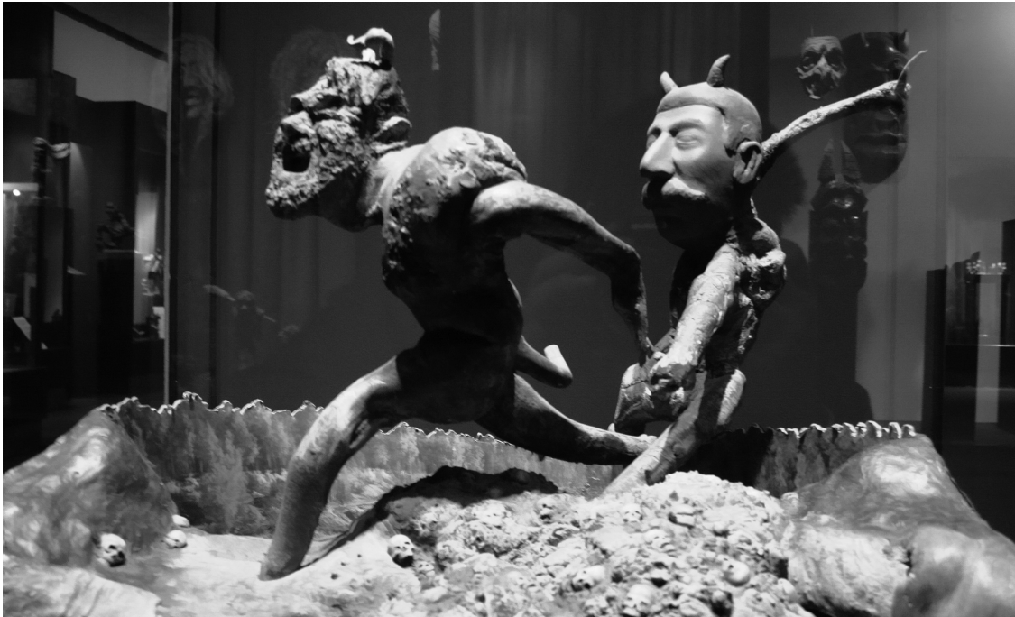
Stalin jaagt op Hitler in het Duivelsmuseum.

En waarom beginnen we dit boek met dit gedeelte? Omdat wij vinden dat er veel gebeurt, en dan vooral in de politiek, dat men heel goed als landverraad kan beschouwen. U ontmoet dat nog wel.