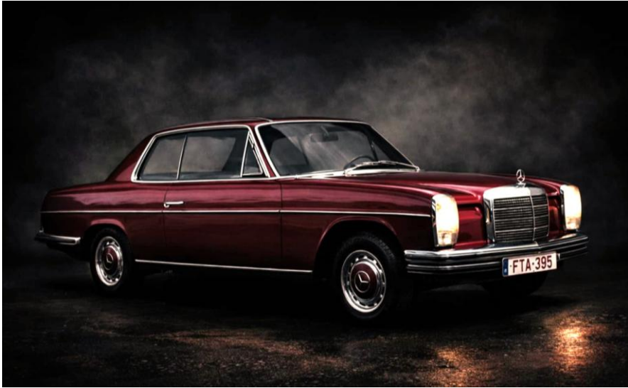
Mercedes 250C/8 coupé 1969

Un autre souvenir de pigeon est lorsque son frère, qui se dit ami des animaux, élevait des pigeons chez eux. Ils étaient encore enfants. D'un œuf était sorti un pigeon avec une légère malformation. D'une manière ou d'une autre, lorsqu'il avait un peu grandi et appris à voler, il devait prendre un petit élan avant de pouvoir s'élever dans les airs. Mais ils avaient aussi un chien, Boris était son nom. Борис en russe. L'oncle le prononçait Baris. Boris était un boxer joueur qui s'entendait bien avec les trois enfants de la maison. Boris était énergique, et cela sans compter le pigeon, qui se retrouva soudain entre les dents de Boris. Le pigeon, apparemment en train de lutter pour sa vie contre la volonté de Boris, tint bon jusqu'à ce que les trois frères rentrent de l'école. La mère cria, Boris fut surpris, laissa tomber brusquement le pigeon de sa gueule sur le sol. Le pigeon donna encore quelques soubresauts. Son frère se consola en disant, «C'est la loi de la nature, la volonté de Dieu.»