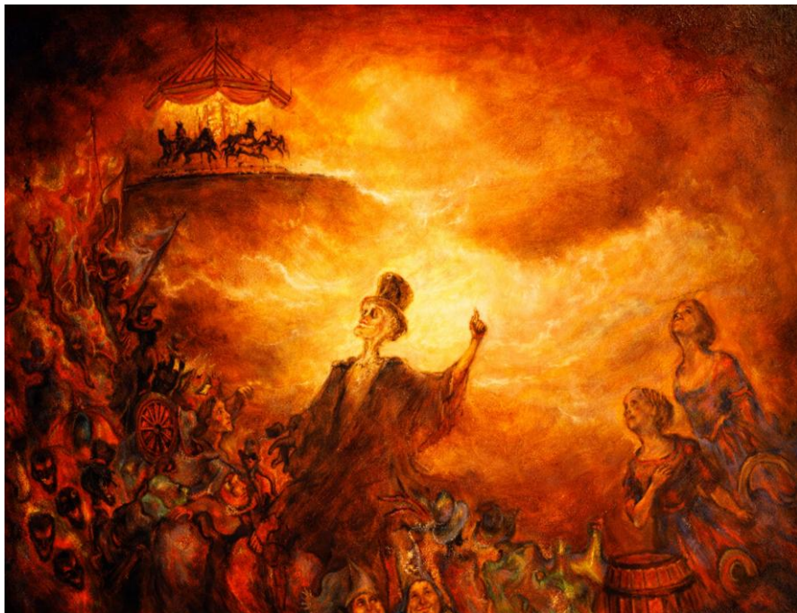
La Parade Ensorienne Collection particulière – Lucifernum

cri existentialiste. Ici, un caleçon blanc au-dessus d'un jean déchiré. Il redresse le dos, glisse sa main gauche dans sa poche, la droite sur sa canne.