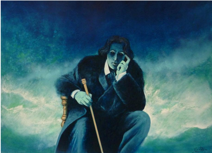
Oscar Wilde

*Nous sommes tous dans le caniveau, mais certains d'entre nous regardent les étoiles.