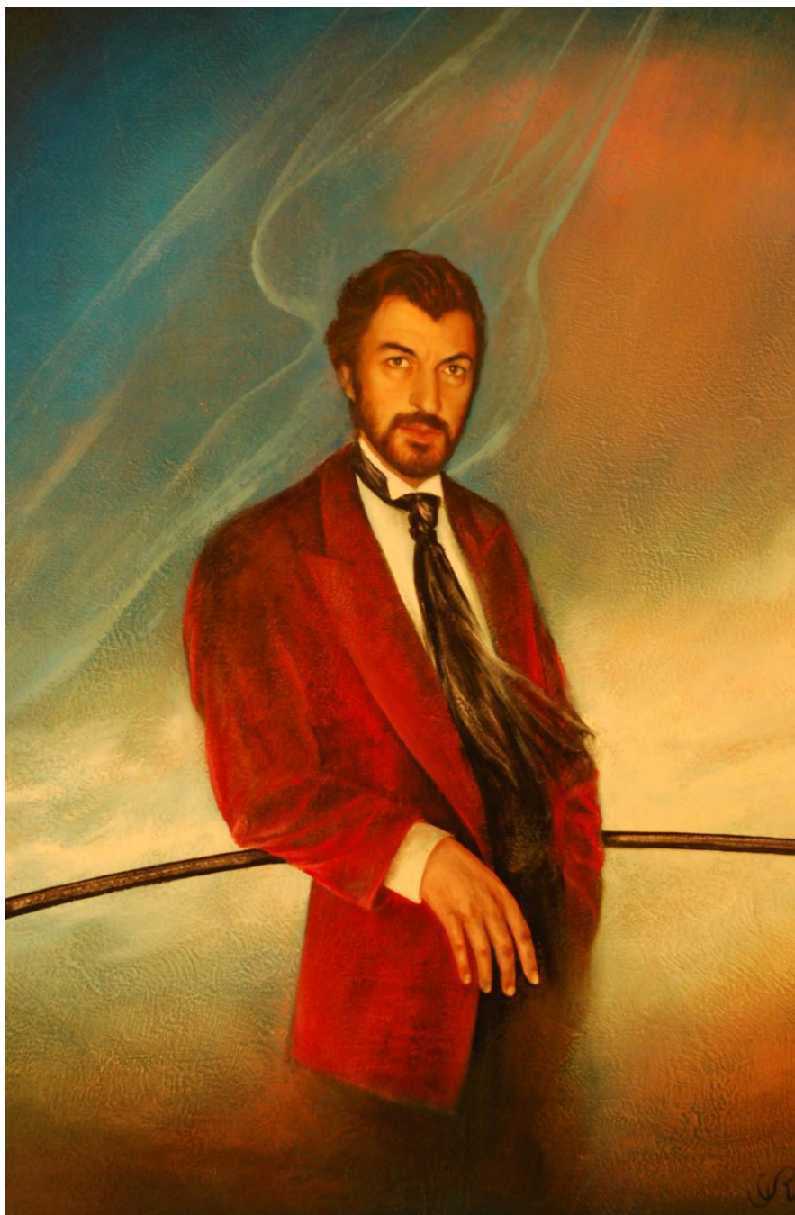
Maître de l'Ombre, Gilbert Retsin Collection particulière – Lucifernum