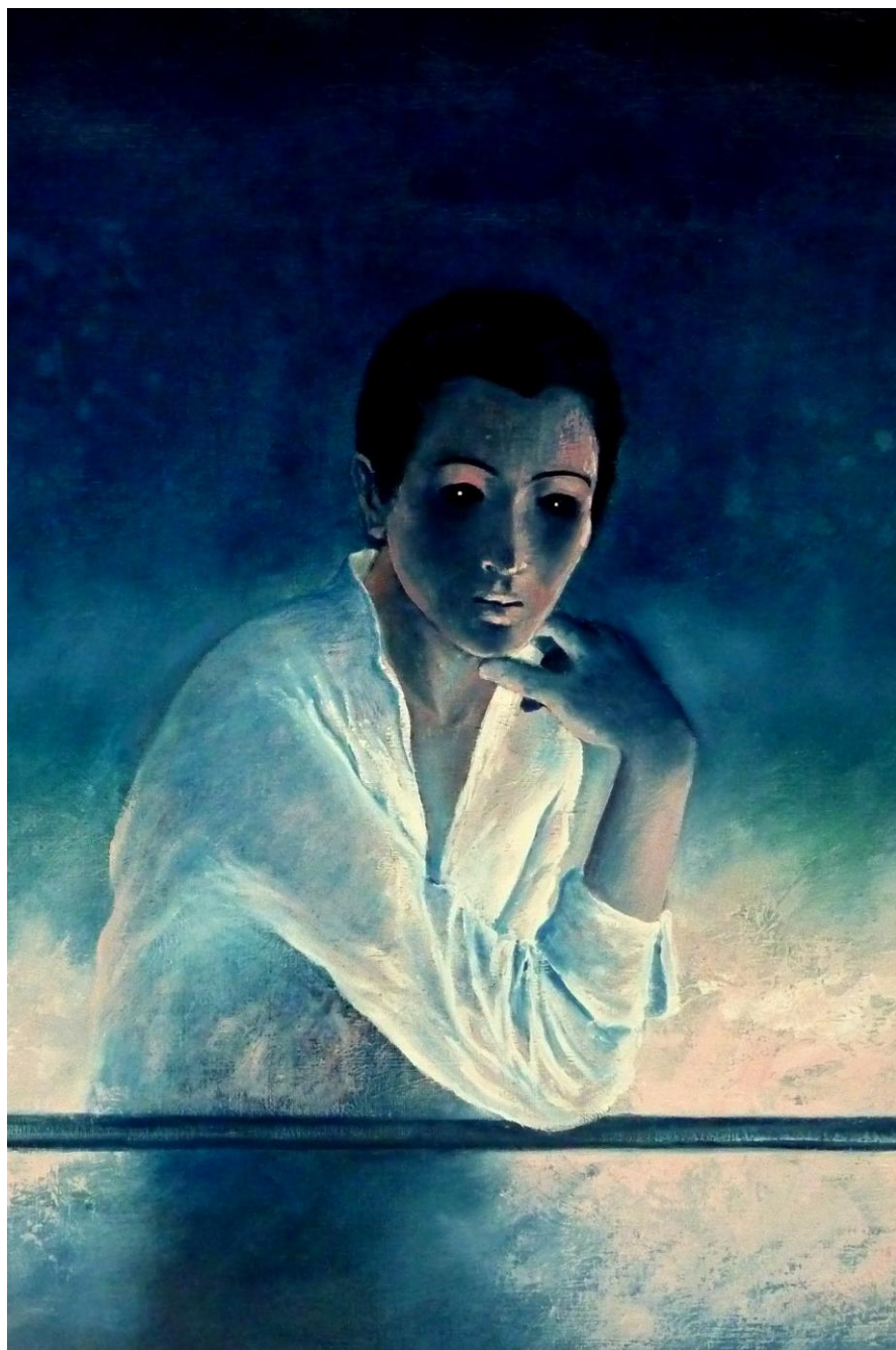
Le Penseur Collection particulière - Lucifernum