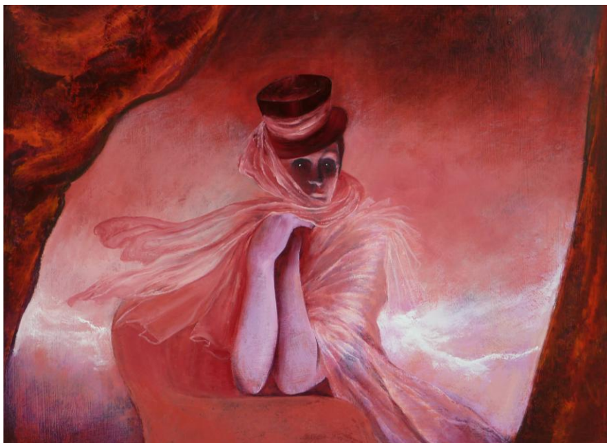
La Vénitienne, Dame des Canaux Collection particulière - Lucifernum

ruelles, franchi ses petits ponts et respiré l'air parfumé de ses coffeeshops, oui. Mais des champs de tulipes? Pas un seul!