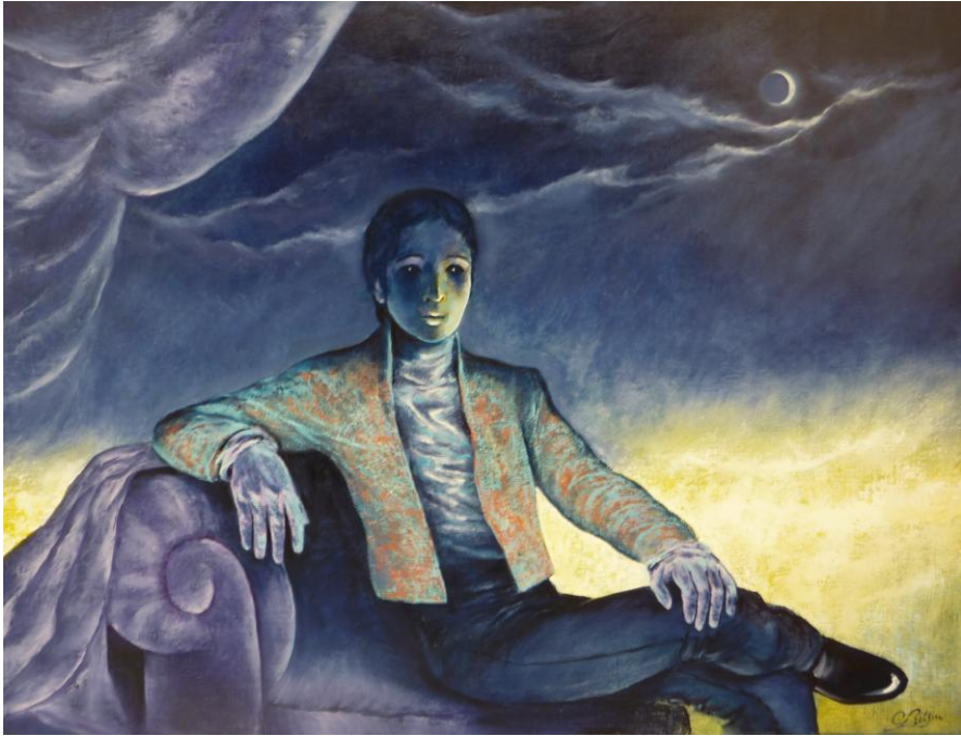
L'Aristocrate Collection particulière – Lucifernum

Il proteste probablement contre le fait de ne pas être sur la scène. Mais à y écouter de plus près, cela sonne comme «check!» En anglais, bien sûr. Parce que l'anglais sonne plus dur. L'anglais cache l'insécurité. L'anglais sonne professionnel, même lorsqu'il sort de la bouche d'un Brugeois qui a appris le latin au Collège Saint-Leo.