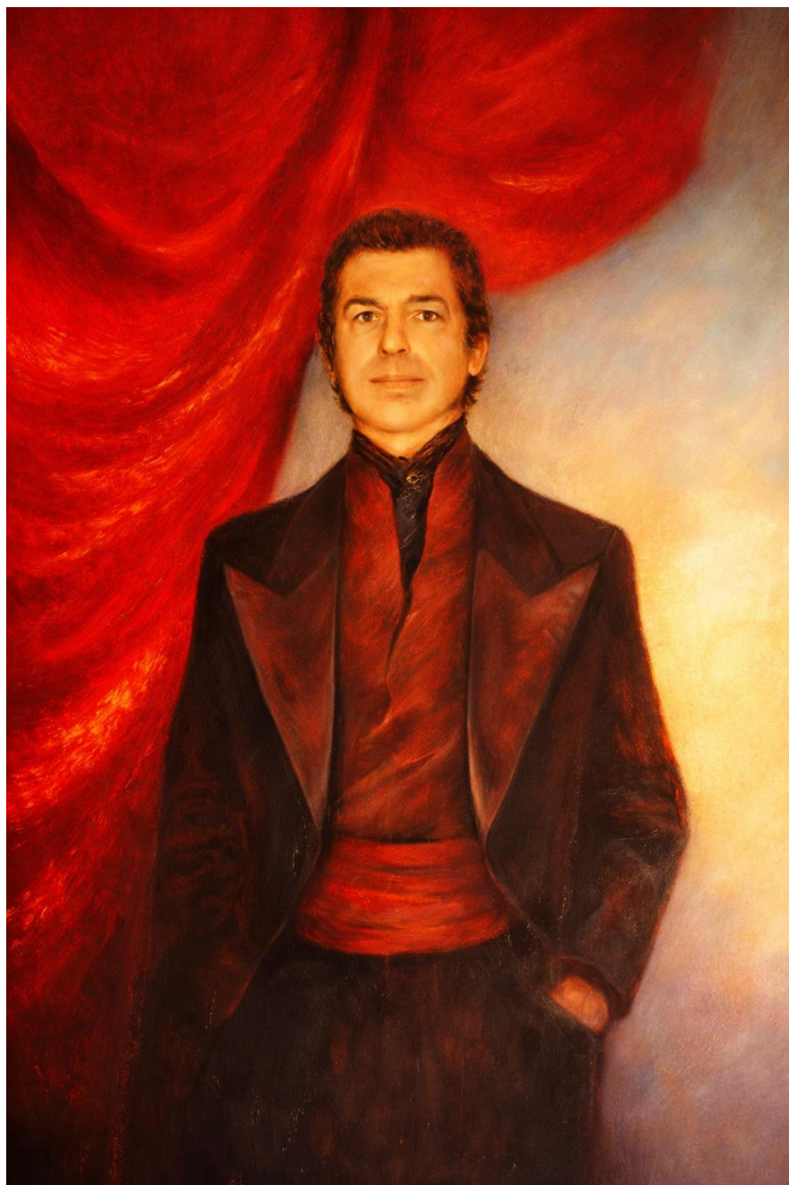
Doctor Retsin Collection particulière – Luciferum