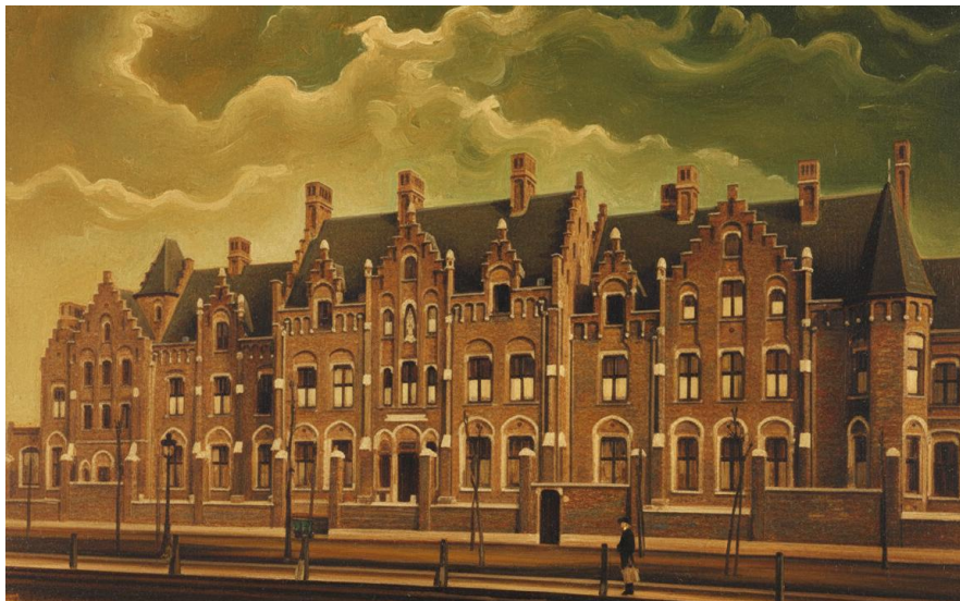
Bruges, Hôpital des Sœurs Augustines de Meaux. 1904 Collection particulière – Lucifernum

par malveillance, mais par instinct. On est pour ou contre. Pas d'entre-deux. Parce que quelque chose en lui bouge plus grand que ce que l'on peut suivre.