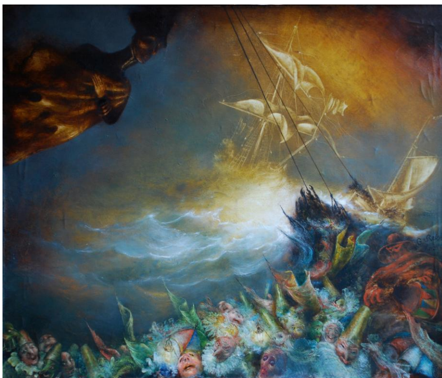
La Tempête des Illusions Collection particulière - Luciferum