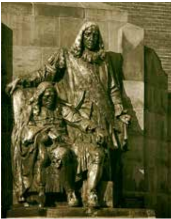
p.16 boven Het standbeeld ter ere van de gebroeders De Witt in Dordrecht (Toon Dupuis en Dirk Roosenburg, 1918)

ongebreidelde groei aan te breken, maar grootmacht Engeland liet zich niet zomaar voorbijstreven. De politiek van de meeste gewestelijke bestuurders om de militairen naar huis te sturen en te bezuinigen op bewapening bleek voorbarig. Tijdens de Eerste Engels-Nederlandse Oorlog (1652-1654) werd de vloot van de Republiek herhaaldelijk verslagen, sneuvelde admiraal Maarten Tromp en werd de kers-verse staat gedwongen tot een ongunstige vrede. Men nam zich voor dezelfde fouten niet een tweede keer te maken