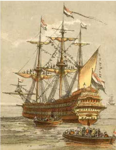
p. 16 onder rechts Illustratie uit 'Twaalf tafereelen uit het leven van Michiel Adriaansz. De Ruyter' (Uitgave Chr. Scheurkalender, Amsterdam, 1883)