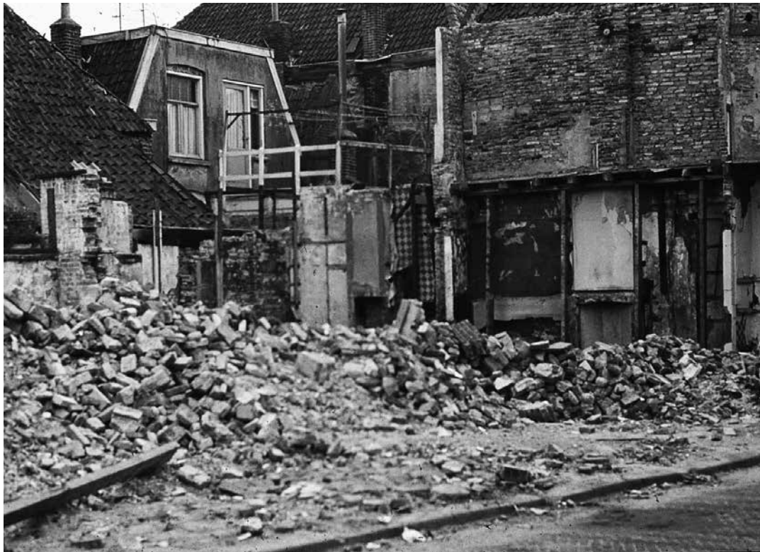
Een gesloopte woning in het Noordenbergkwartier.

als toonaangevende industriestad. Alle toekomstprognoses vielen in duigen, de gemeente kwam steeds meer geld tekort en het eerste plan verstofte in een lade.