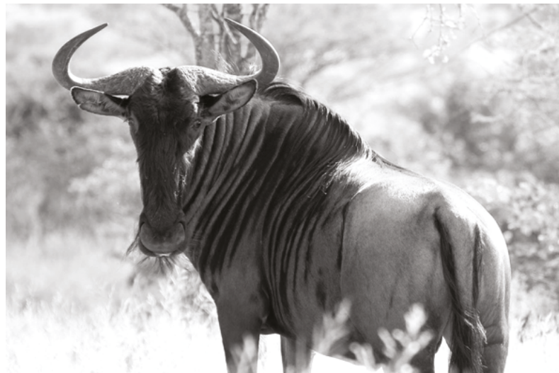
Een gnoe (niet dé gnoe)

De route gaat als een dolle verder naar het betreffende ministerie. De ambtenaren hebben hier de zware taak om te onderzoeken hoe het heeft kunnen gebeuren dat een gnoe Nederland in gevaar heeft gebracht. Wat is het huidige veiligheidsbeleid ten aanzien van savannedieren? Is het protocol gevolgd? Had de inval voorkomen